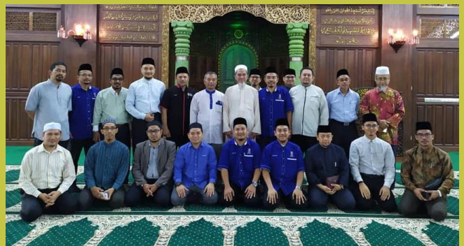
Lawatan ke Masjid Ar-Rahman Pulau Gajah