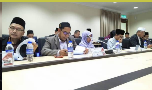
Mesyuarat Jawatankuasa Hal Ehwal Islam IPT