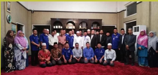
Majlis Ramah Mesra di Kediaman Rasmi Menteri Besar di Kediaman Rasmi Menteri Besar (JKR 10)